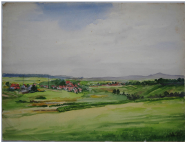
© gemeinfrei; Erben unbekannt; Margarete Martus Foto: Thomas Kumlehn