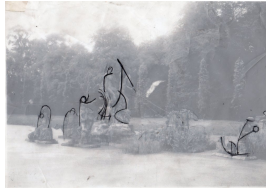
Neptuns Triumph 2004 Entwurfszeichnung Bleistift auf Pergament, darunter ein Foto der Neptungruppe

© Sophie Rook