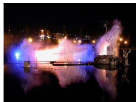
Neptuns Triumph 2004 Edelstahl mit Projektion 4 x 2 x 24 m

© Sophie Roock