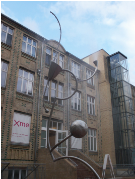
© Sophie Roock Foto: Bildarchiv Nachlass Rainer Fürstenberg