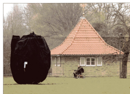
Mirakel, 29.11.2004 (verhüllt) Standort: Freundschaftsinsel, Potsdam Reaktion des Künstlers, weil die Stadt Potsdam das Werk nicht ankaufte.