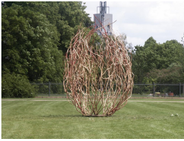
© Sophie Roock Foto: Bildarchiv Nachlass Rainer Fürstenberg