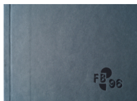
FB 96, 2012 Cover

© VG Bild-Kunst, Bonn; Heike Hentrich