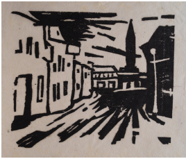
© VG Bild-Kunst, Bonn; Heike Hentrich