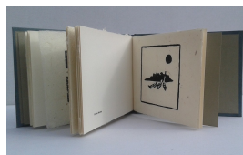
Kleine Marina, 2012