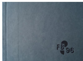
FB 96, 2012 Cover

© VG Bild-Kunst, Bonn; Heike Hentrich Foto: Thomas Kumlehn