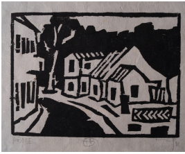
© VG Bild-Kunst, Bonn; Heike Hentrich