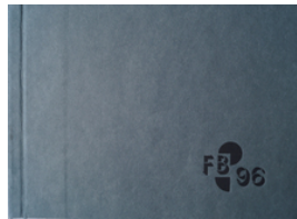
FB 96, 2012 Cover

© VG Bild-Kunst, Bonn; Heike Henrich Foto: Thomas Kumblehn