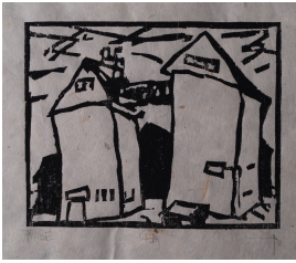
© VG Bild-Kunst, Bonn; Heike Hentrich