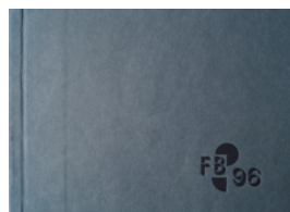
FB 96, 2012 Cover

© VG Bild-Kunst, Bonn; Heike Hentrich