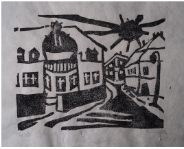
© VG Bild-Kunst, Bonn; Heike Hentrich