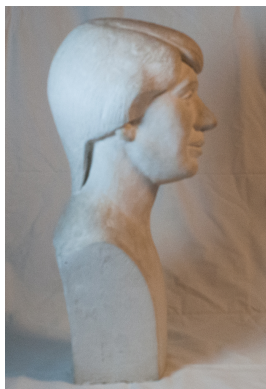
Elzbieta, 1982 Gips 50 x 22 x 17 cm

© VG Bild-Kunst, Bonn; Grischa und Thomas Worner