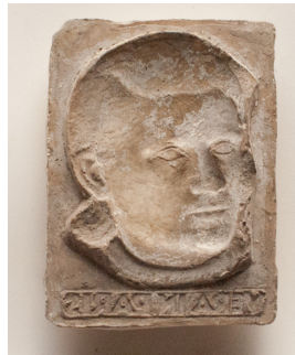
Vera in Paris, 1956/57 Gipsform 11 x 8 x 2 cm

© VG Bild-Kunst, Bonn; Grisca und Thomas Worner