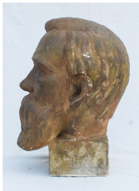
Engels, 1947 Gips 49 x 26 x 34 cm

© VG Bild-Kunst, Bonn; Grischa und Thomas Wörner