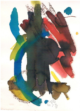
© Daniela, Heike und Rose-Maria Reinhold Foto: Heike Reinhold