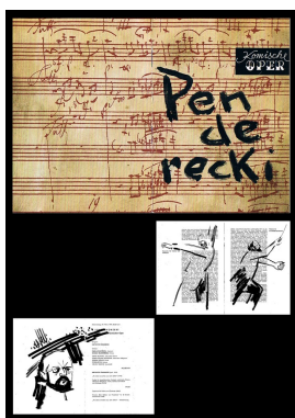
Programmheft, Konzert Komische Oper, 1975 Tusche, teilweise übermalt 20 x 14 cm

© Daniela, Heike und Rose-Maria Reinhold Foto: Thomas Bartnig