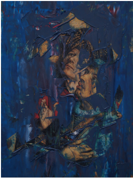
© Hendrikje Beschnidt Foto: Thomas Kumlehn