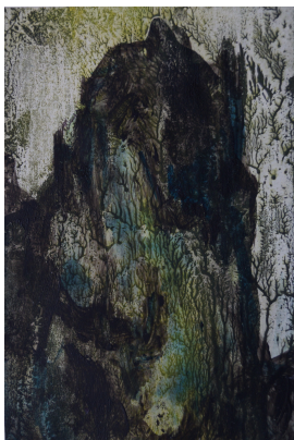
© Hendrikje Beschnidt Foto: Thomas Kumlehn