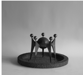
Brunnengestaltung 1972 Edelstahl, Kupfer, getrieben Modell 1:10

© VG Bild-Kunst, Bonn; Alice Bahra; Christian Roehl Foto: Alice Bahra/ Archiv Christian Roehl, Potsdam