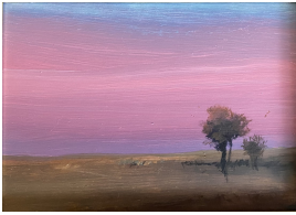
© Kim Wilde Foto: Annette Purfürst