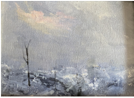
© Kim Wilde Foto: Annette Purfürst