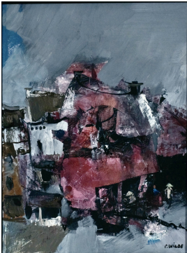
© Kim Wilde Foto: Annette Purfürst