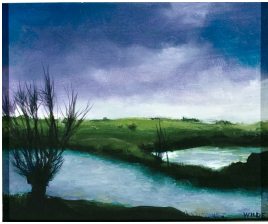
© Kim Wilde Foto: Annette Purfürst