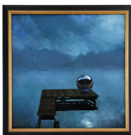
Peter Wilde Die Faszination des letzten Steges, 1999 Öl auf Leinwand, 90 x 90 cm Privatbesitz