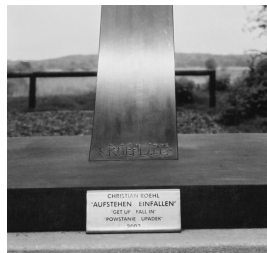
AufstehenEinfallen I, Detail mit Hinweisschild 2003 Edelstahl, gebaut, montiert 450 x 540 x 100 cm

© VG Bild-Kunst, Bonn; Alice Bahra; Christian Roehl Foto: Alice Bahra/ Archiv Christian Roehl, Potsdam