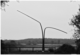
© VG Bild-Kunst, Bonn; Alice Bahra; Christian Roehl Foto: Alice Bahra/ Archiv Christian Roehl, Potsdam