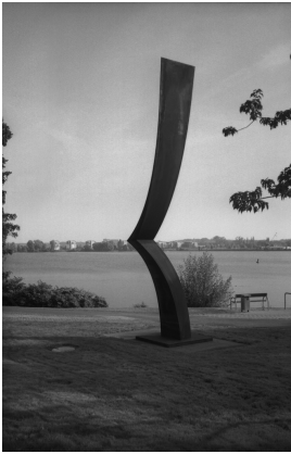
© VG Bild-Kunst, Bonn; Alice Bahra; Christian Roehl Foto: Alice Bahra/ Archiv Christian Roehl, Potsdam