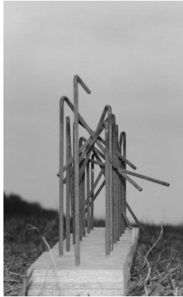
Fahnenmasten – Legende des Zusammenbruchs 1993 15-teilig Baustahl, verzinkt Modell 1:10

© VG Bild-Kunst, Bonn; Alice Bahra; Christian Roehl