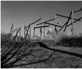
© VG Bild-Kunst, Bonn; Alice Bahra; Christian Roehl Foto: Alice Bahra/ Archiv Christian Roehl, Potsdam