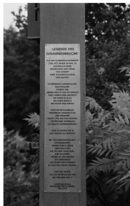
Fahnenmasten – Legende des Zusammenbruchs, Hinweisschild mit eigenem Text und Bezeichnung 1993 15-teilig Baustahl, verzinkt 800 x 1400 x 600 cm

© VG Bild-Kunst, Bonn; Alice Bahra; Christian Roehl Foto: Scan/ Archiv Christian Roehl, Potsdam