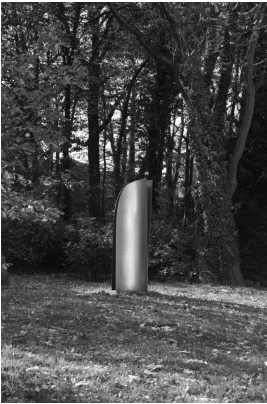
© VG Bild-Kunst, Bonn; Alice Bahra; Christian Roehl Foto: Alice Bahra/ Archiv Christian Roehl, Potsdam