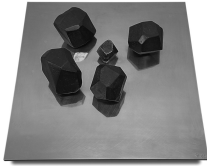
© VG Bild-Kunst, Bonn; Alice Bahra; Christian Roehl Foto: Alice Bahra/ Archiv Christian Roehl, Potsdam