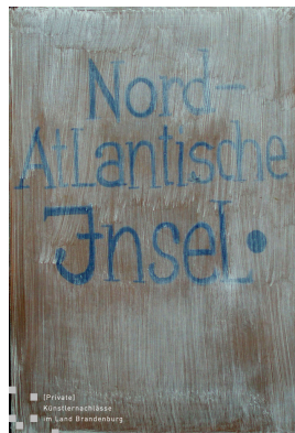
Nord-Atlantische Insel (verso) 1980 Öl mit Eitempera auf Hartfaser 75 x 53,5 cm