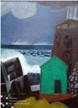
© Robert und Hendrik Robbel Foto: Thomas Kumlehn