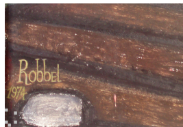
Schaffende Kräfte (Studie zur linken Tafel) Bildausschnitt mit Signatur und Datierung 1974 Öl mit Eitempera auf Hartfaser 64 x 35,5 cm

© Robert und Hendrik Robbel Foto: Thomas Kumlehn