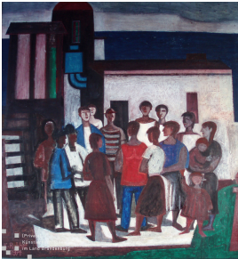
© Robert und Hendrik Robbel Foto: Thomas Kumlehn