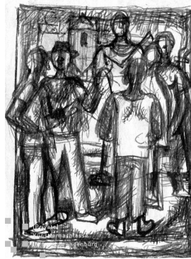
unbenannt undatiert Kugelschreiber auf Papier 6,5 x 5 cm

© Robert und Hendrik Robbel