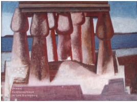
© Robert und Hendrik Robbel Foto: Thomas Kumlehn