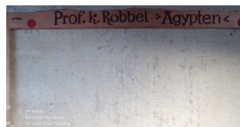
Ägypten (verso) 1974 Öl mit Eitempera auf Leinwand 69 x 94 cm

© Robert und Hendrik Robbel