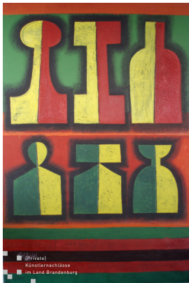
© Robert und Hendrik Robbel Foto: Thomas Kumlehn