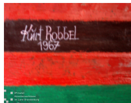
Figuren im Simultankontrast Bildausschnitt mit Signatur und Datierung 1967 Eitempera mit Öl auf Hartfaser 90 x 62 cm

© Robert und Hendrik Robbel Foto: Thomas Kumlehn