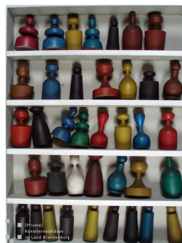
Kastenregal mit Holzfiguren Holz 69 x 53 cm

© Robert und Hendrik Robbel