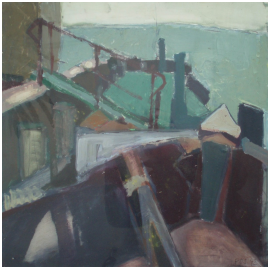
© VG Bild-Kunst, Bonn; Rose und Otto Schack