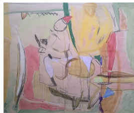
Zirkus 1994 Mischtechnik/Papier 48 x 57 cm