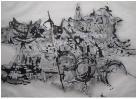
© Hans-Joachim Rose Foto: Thomas Kumlehn