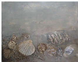
unbenannt undatiert Tempera auf Karton 26 x 33 cm verso u.l. (von fremder Hand): S/C 24 Nachlass-Stempel: Aus dem Besitz von / Becky Sandstede / (Gertrud Kirchberger)