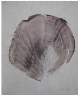
unbenannt 1985 Aquarell auf Aquarellkarton 44 x 36 cm sign. recto u.r.: B. Sandstede / 85 verso u.l. (von fremder Hand): S/C 22

© Hans-Joachim Rose Foto: Thomas Kumlehn