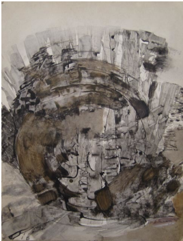
© Hans-Joachim Rose Foto: Thomas Kumlehn