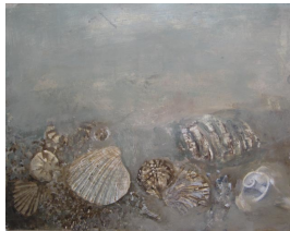
unbenannt undatiert Tempera auf Karton 26 x 33 cm verso u.l. (von fremder Hand): S/C 24 Nachlass-Stempel: Aus dem Besitz von / Becky Sandstede / (Gertrud Kirchberger)

© Hans-Joachim Rose