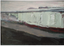
© VG Bild-Kunst, Bonn; Rose und Otto Schack