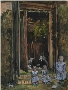
© gemeinfrei; Erben unbekannt; Margarete Martus Foto: Thomas Kumlehn