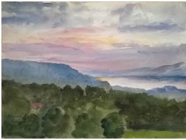
© gemeinfrei; Erben unbekannt; Margarete Martus Foto: Thomas Kumlehn