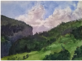
© gemeinfrei; Erben unbekannt; Margarete Martus Foto: Thomas Kumlehn