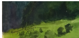
Margarete Martus Wengen 1913 Gouache, Aquarellfarbe, Bleistift 24.5 x 33.5 cm Bildausschnitt recto u.l.: Margarete Martus / Juli 1913

© gemeinfrei; Erben unbekannt; Margarete Martus