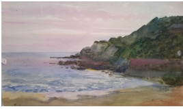
© gemeinfrei; Erben unbekannt; Margarete Martus Foto: Thomas Kumlehn