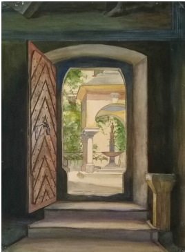
© gemeinfrei; Erben unbekannt; Margarete Martus

Nachlass: Martus, Margarete [Nachlassverzeichnis Malerei, Farbige Arbeiten auf Papier]