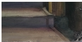
Margarete Martus St. Wolfgang - Salzkammergut 1909 Gouache, Aquarellfarbe, Bleistift 44 x 32,5 cm Bildausschnitt recto u.r.: Marg. Martus / 1909

© gemeinfrei; Erben unbekannt; Margarete Martus