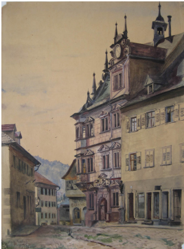
© gemeinfrei; Erben unbekannt; Margarete Martus Foto: Thomas Kumlehn