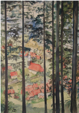
© gemeinfrei; Erben unbekannt; gemeinfrei Foto: Thomas Kumlehn