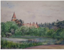
© gemeinfrei; Erben unbekannt; Margarete Martus Foto: Thomas Kumlehn