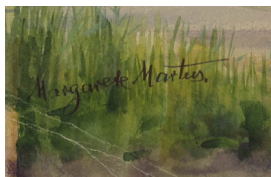
Margarete Martus Restaurant Hundekehle undatiert Aquarellfarbe, Bleistift 24,5 x 31,5 cm Bildausschnitt recto u.l.: Margarete Martus.

© gemeinfrei; Erben unbekannt; Margarete Martus