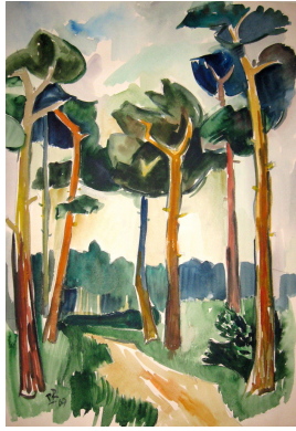
Kiefern, 1969 Aquarell 73 x 51 cm

© Daniela, Heike und Rose-Maria Reinhold