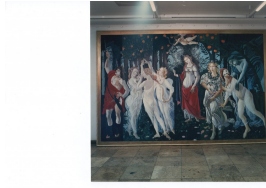
Kopie Sandro Botticelli "LA PRIMAVERA" Versuch einer Enthüllung 1992 Öl/Leinwand

© VG Bild-Kunst, Bonn; Philipp Schack Foto: Philipp Schack