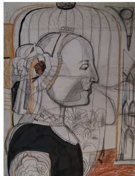
Studie 1991/92 Mischtechnik/Papier Maße unbekannt

© VG Bild-Kunst, Bonn; unbekannt