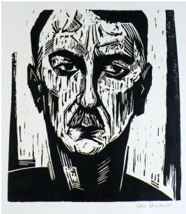
© Daniela, Heike und Rose-Maria Reinhold Foto: Thomas Bartnig

Nachlass: Reinhold, Peter [Nachlassverzeichnis Grafik und Collage] Nachlass-Nummer: 038 Objekttyp: Grafik Beschreibender Titel: Portrait Karol Szymanowski Entstehungsort: Berlin